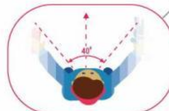
ОПАСНОЕ ТУННЕЛЬНОЕ ЗРЕНИЕ

При переходе проезжей части обязательно держите ребёнка за руку и первым делом научите разворачиваться и смотреть по сторонам: сначала налево, потом направо, а дойдя до середины дороги – снова направо!