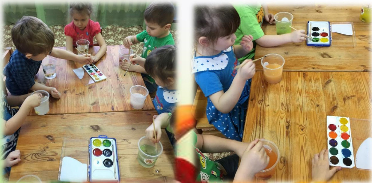
Поисковая деятельность детей. Опыты с водой: «Прятки с водой»