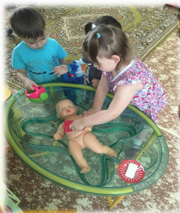
Дидактическая игра: «Мы не ляжем рано спать, дочку надобно купать»