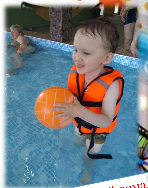
Наблюдение и игры с водой дома. «Водные процедуры»