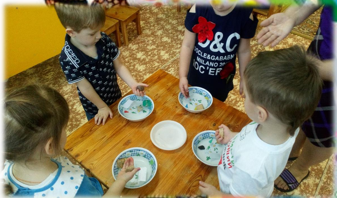
«Тонет – не тонет»