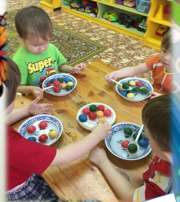
«Достань шарик из воды»