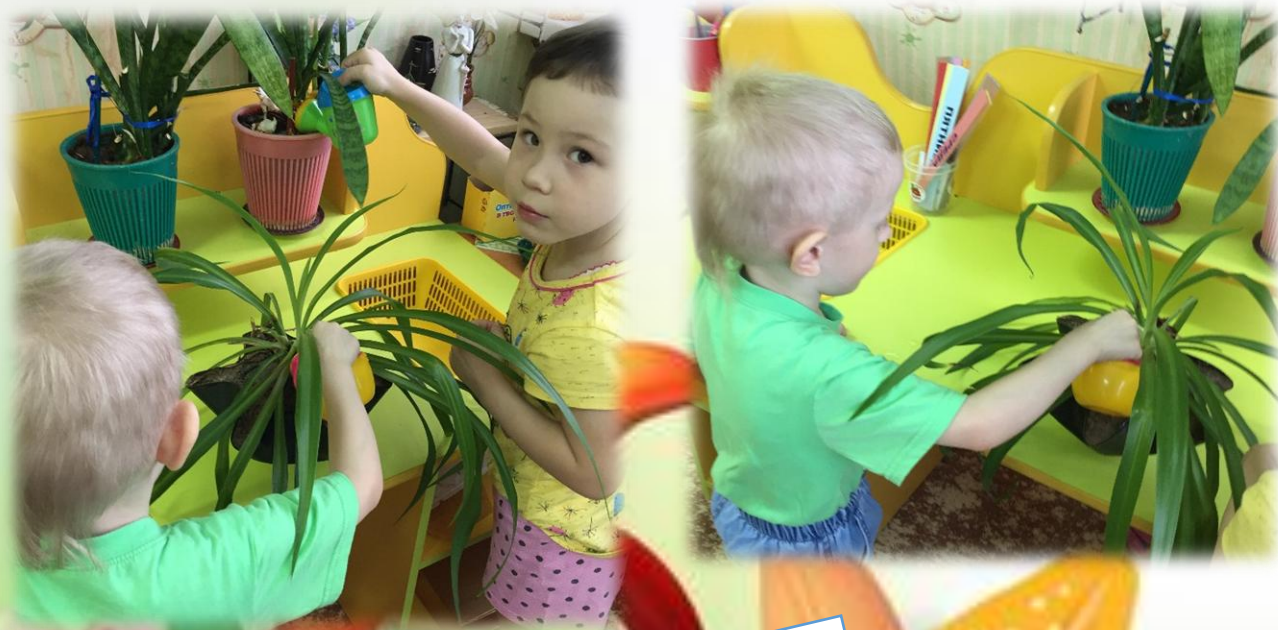
«Как растения пьют воду»